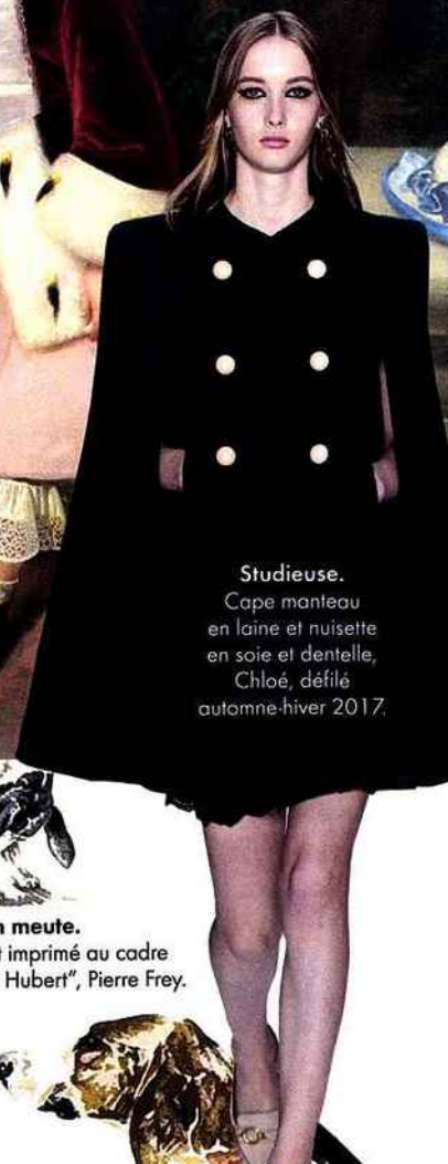
Studieuse. Cape manteau en laine et nuisette en soie et dentelle, Chloé, défilé automne-hiver 2017.