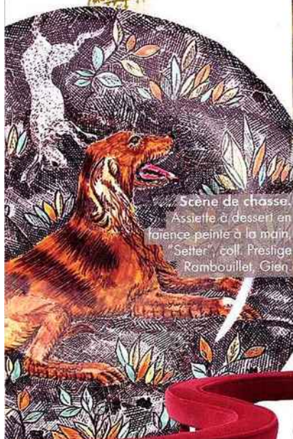
Scène de chasse. Assiette à dessert en porcelaine peinte à la main, "Setter", coll. Prestige Rambouillet, Gien.