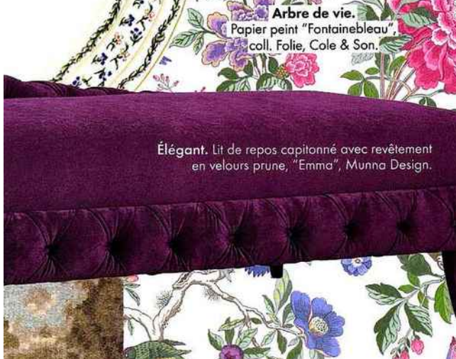
Élegant. Lit de repos capitonné avec revêtement en velours prune, "Emma", Munna Design.