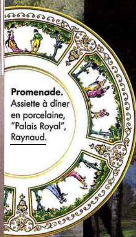
Promenade. Assiette à dîner en porcelaine, "Palais Royal", Raynaud.