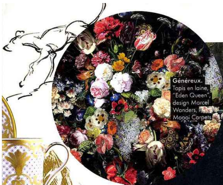
Généreux. Tapis en laine, "Eden Queen", design Marcel Wanders, Moooi Carpets.