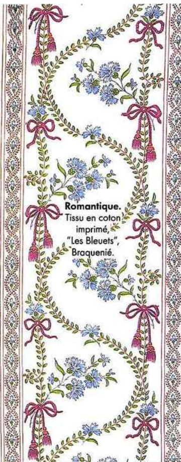
Romantique. Tissu en coton imprimé, "Les Bleuets", Braquenié.

* "Enfance dévoilée. L'image des enfants dans l'art romantique espagnol", jusqu'au 15 octobre 2017, musée national du Prado, Madrid.