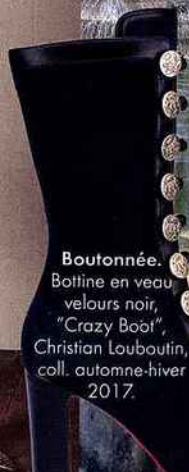
Boutonnée. Bottine en veau velours noir, "Crazy Boot", Christian Louboutin, coll. automne-hiver 2017.