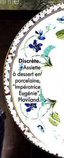
Discrète. Assiette à dessert en porcelaine, "Impératrice Eugénie", Haviland.