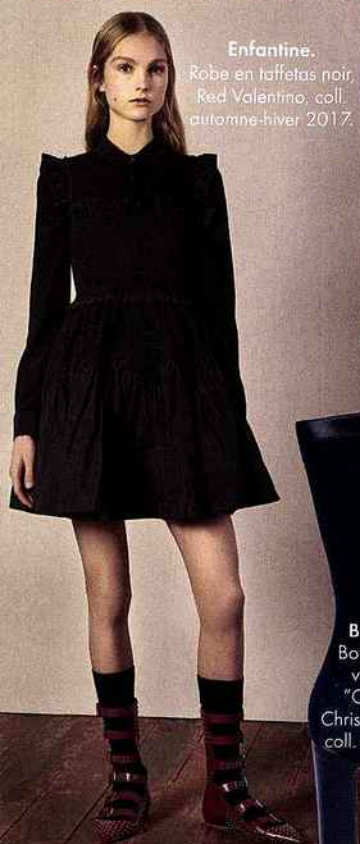
Enfantine. Robe en taffetas noir, Red Valentino, coll. automne-hiver 2017.