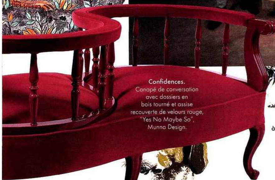
Confidences. Canapé de conversation avec dossiers en bois tourné et assise recouverte de velours rouge, "Yes No Maybe So", Munna Design.