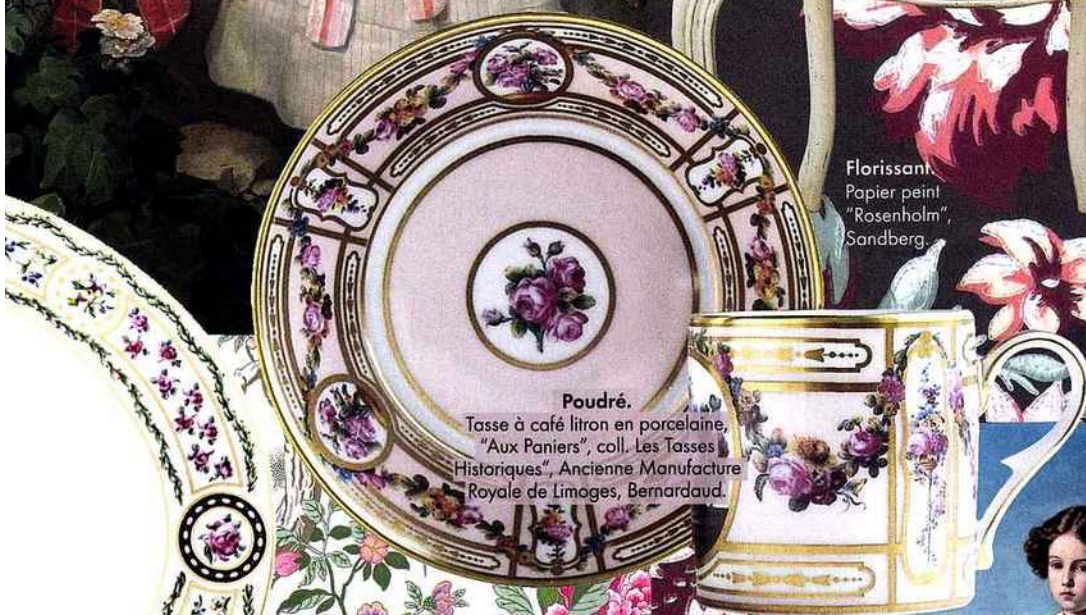
Poudré. Tasse à café litron en porcelaine, "Aux Paniers", coll. Les Tasses Historiques, Ancienne Manufacture Royale de Limoges, Bernardaud.