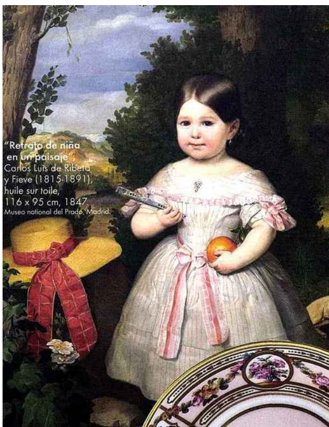
"Retrato de niña en un paisaje", Carlos Luis de Ribera y Fieue (1815-1891), huile sur toile, 116 x 95 cm, 1847. Museo nacional del Prado, Madrid.